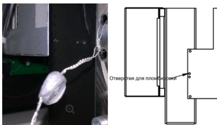
Рисунок А.3 - Пломбировка электронно-цифрового блока