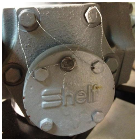
Рисунок А.2 - Пломбировка измерителя объема типа Shelf